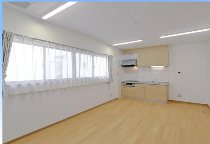
共同生活室（居間・食堂）

共同生活室では温かい雰囲気の中でホッとした空間を準備。みんなが自然と集まり、ワイワイと食事や団らんが出来るスペースを目指しました。南側全面に広がるウインドウからは暖かい陽の光が差し込み、居心地の良い居住空間でゆったりと流れる穏やかな時間をお過ごし頂けます。