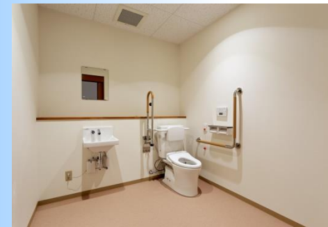
バリアフリーストイル